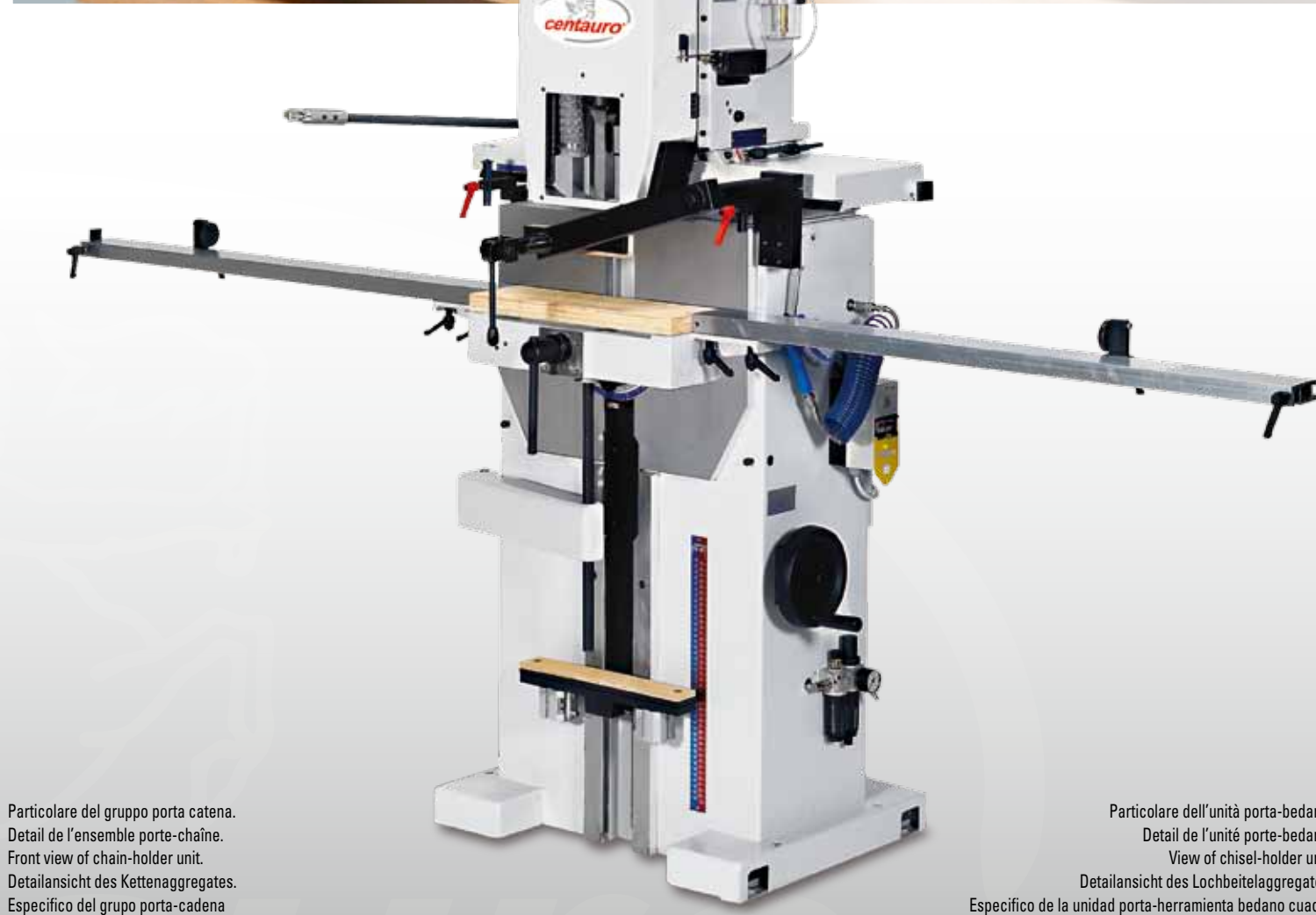
Particolare del gruppo porta catena. Detail de l'ensemble porte-chaîne. Front view of chain-holder unit. Detailansicht des Kettenaggregates. Especifico del grupo porta-cadena

La CBO esta disponible tambien en version simple, sola para cadena