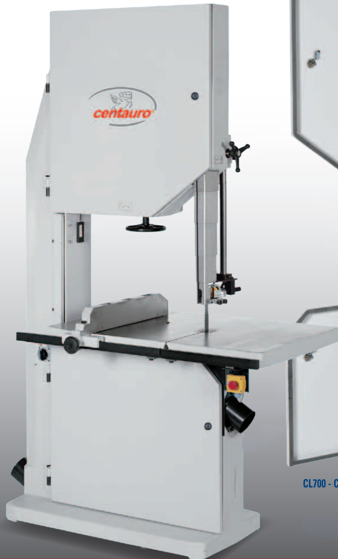
CL700 - CL800

SEGHE A NASTRO IN GHISA SCIES À RUBAN EN FONTE BAND SAWS IN CAST-IRON BANDSÄGEN AUS GUSS SIERRAS DE CINTA EN FUNDICION