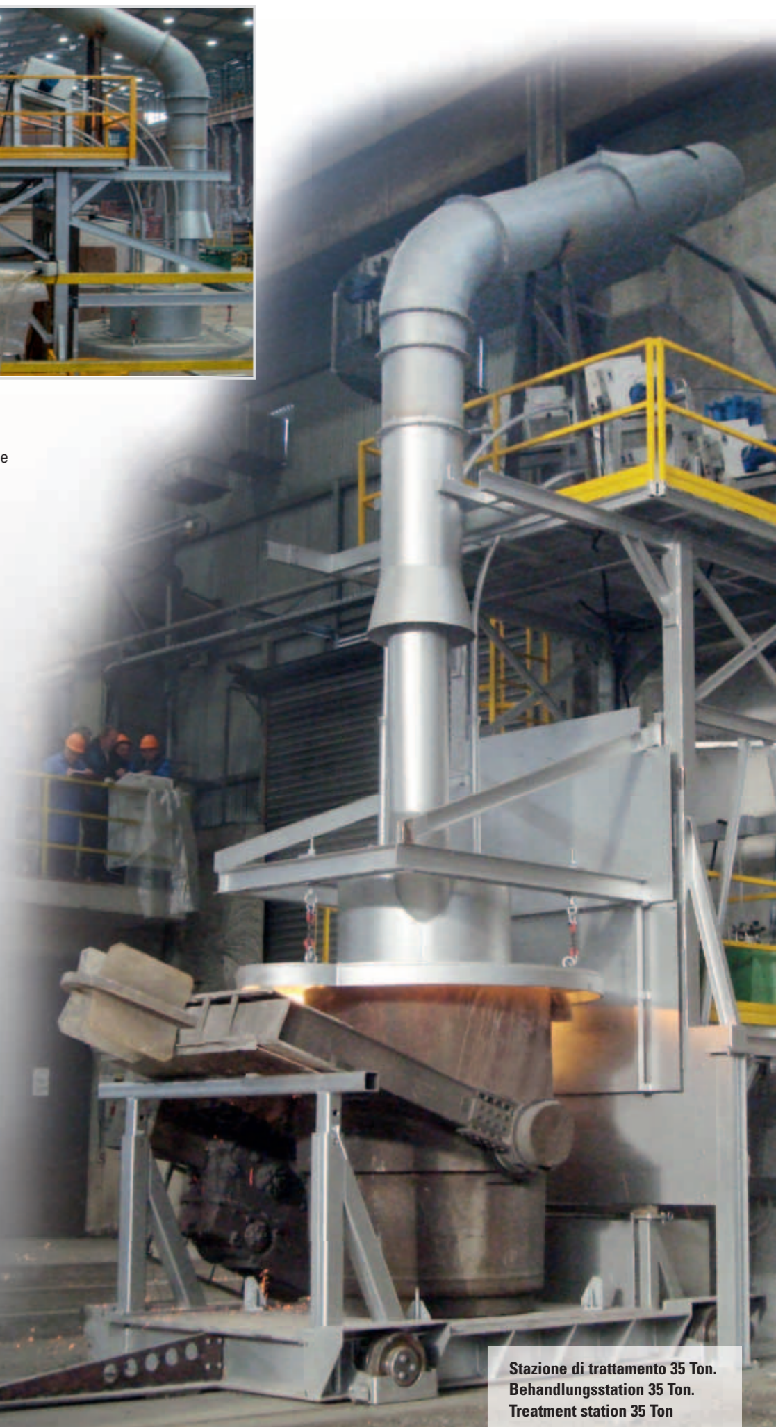
Stazione di trattamento 35 Ton. Behandlungsstation 35 Ton. Treatment station 35 Ton

With 2 or more SFR units, the software allows the correct completion of the spheroidisation cycle even in the case of shut down of a unit during the cycle itself.